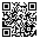
▲こちらより ご覧いただけます