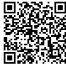
▲こちらより ご覧いただけます