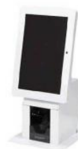
アトラス情報サービス 株式会社