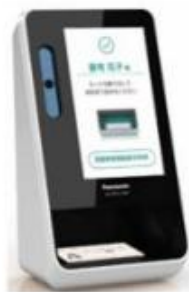
パナソニック コネクト 株式会社