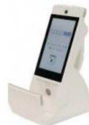
キヤノンマーケティング ジャパン株式会社