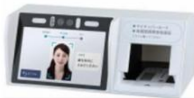
株式会社アルメックス